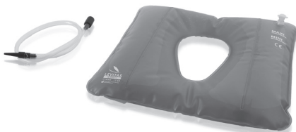
ST327 PVC water cushion with central hole

The water cushion is made of electrosoldered PVC, to guarantee maximum strength. It has interior bellows to avoid wave-like motion of water and a refilling tube.